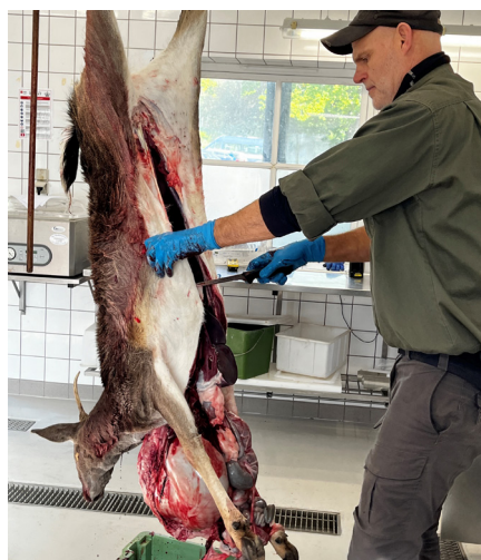
En del af opgaven som skovløber i Dyrehaven er at gøre dådyr klar til videresalg, efter de er skudt.