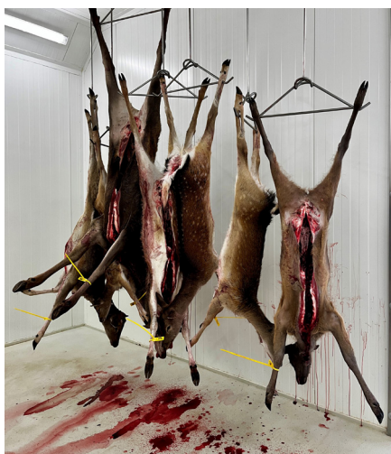
De dådyr, der bliver skudt i Dyrehaven, sælges og kødet ender på forskellige restauranter i Danmark.